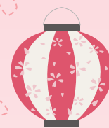
桜ボンボリ SAKURA BORIBORI