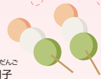
さんしょくだんご 三色団子