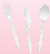
使い捨てナイフ Tsukaisute fôku Tenedor descartable