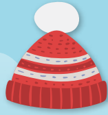
ニット帽子 NITTOBŌSHI Gorro de punto