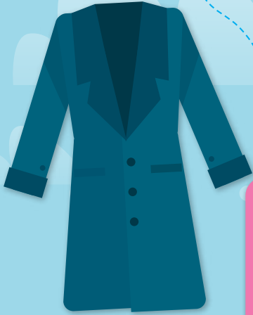
コート KŌTO Abrigo