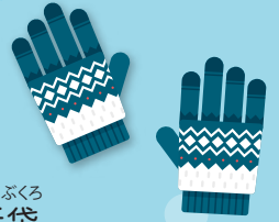
てぶくろ 手袋 TEBUKURO Guantes