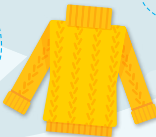
タートルネックセーター TĀTORUNEKKUSĒTĀ Chompa de cuello alto