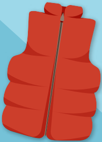
ダウンベスト DAUN BESUTO Chaleco de pluma

C T Z C A R V W D H L W O C H Ā J X M X S Ē T Ā K W P T D V R T O A Z L T X N X C F U T A U C Ē C H X I A L B Z F S N K F N O S M Ē G Y A O O N E Ā G A O T Q U I C W V P Ā S B T S M S I Y D K V P H P C P N Ē P O M K Ā K L K P O N D A U S O Ā A K N I I Q E Z T I T A U N B B O K O M D Z N Y Ō D D K A K T I B U T M Y M I L K U K T X H S Ū G T T J Y B U P F E U Y S I T Z E S E P J T B A N D U Z O S B E I U K K U M M U F C T T U F T K U S A Q B Ā R Ē W Q K Ā T A Ē Ō H J X Y O E N U I H S Ō B O T T I N I T V R L F O W B Q H D T M T J Ā O Y L V G M G Q X M F Ō T A T G O B O M I T O N Y Ē V E X G