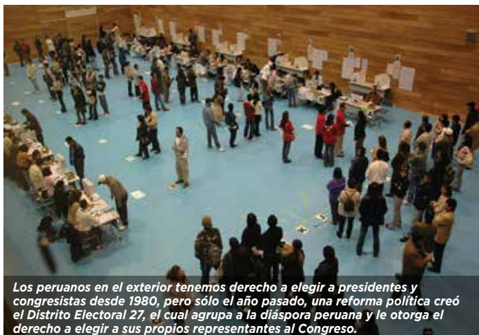
Los peruanos en el exterior tenemos derecho a elegir a presidentes y congresistas desde 1980, pero sólo el año pasado, una reforma política creó el Distrito Electoral 27, el cual agrupa a la diáspora peruana y le otorga el derecho a elegir a sus propios representantes al Congreso.

Finalmente, desde el 2008 Ecuador reserva seis curules de los 137 que componen su Asamblea Nacional, para los ecuatorianos radicados en el exterior. Estos escaños se dividen en tres circunscripciones de dos cupos cada una para los ciudadanos radicados en Europa, Asia y Oceanía; Estados Unidos y Canadá; y América Latina, el Caribe y África. ■