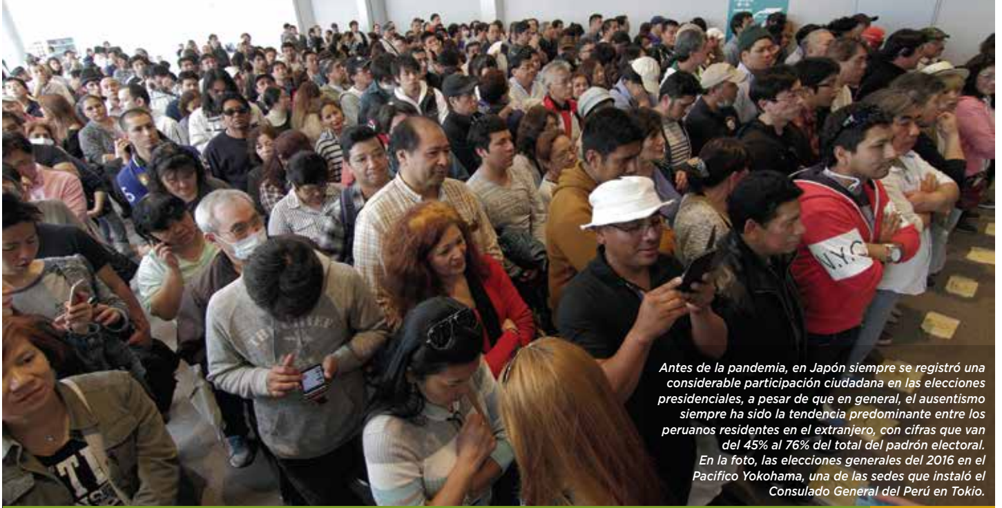
Antes de la pandemia, en Japón siempre se registró una considerable participación ciudadana en las elecciones presidenciales, a pesar de que en general, el ausentismo siempre ha sido la tendencia predominante entre los peruanos residentes en el extranjero, con cifras que van del 45% al 76% del total del padrón electoral. En la foto, las elecciones generales del 2016 en el Pacífico Yokohama, una de las sedes que instaló el Consulado General del Perú en Tokio.