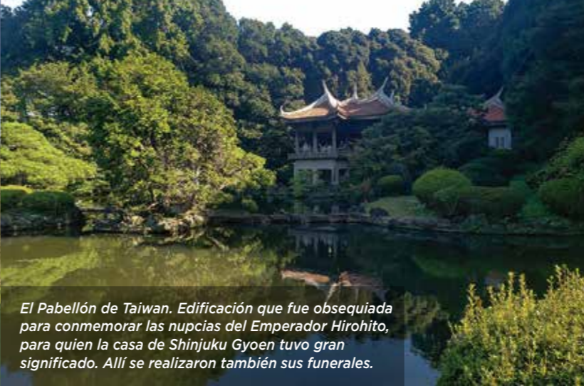
El Pabellón de Taiwán. Edificación que fue obsequiada para conmemorar las nupcias del Emperador Hirohito, para quien la casa de Shinjuku Gyoen tuvo gran significado. Allí se realizaron también sus funerales.