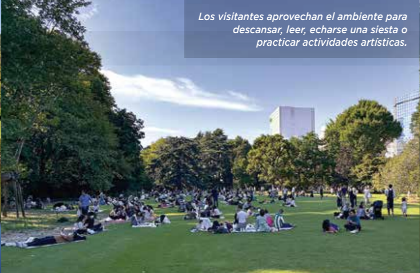
Los visitantes aprovechan el ambiente para descansar, leer, echarse una siesta o practicar actividades artísticas.