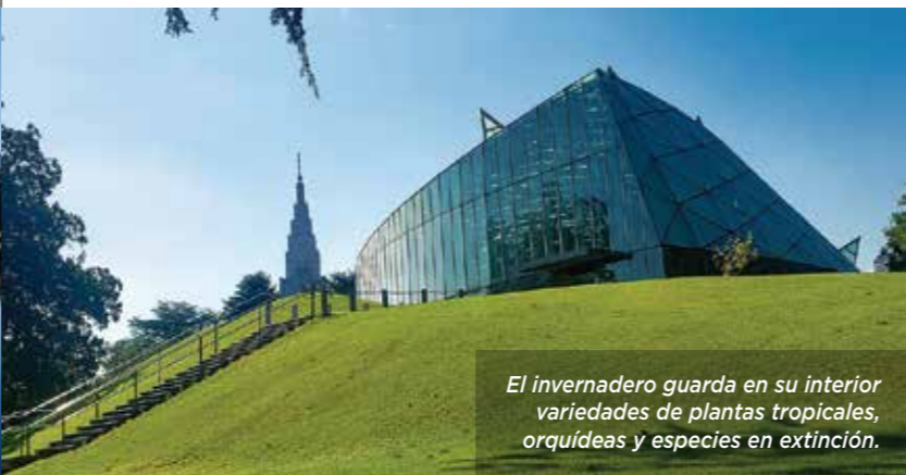
El invernadero guarda en su interior variedades de plantas tropicales, orquídeas y especies en extinción.

ACCESO Puede ingresarse desde tres entradas ( Sendagaya, Shinjuku y Shinjuku Gyoenmae ). Se encuentra a unos 800 metros caminando desde la salida sureste de la estación de Shinjuku, muy cerca del local de Ikea. También puede llegarse tomando la línea de subterráneo Marunouchi, descendiendo en la estación Shinjuku Gyoenmae.