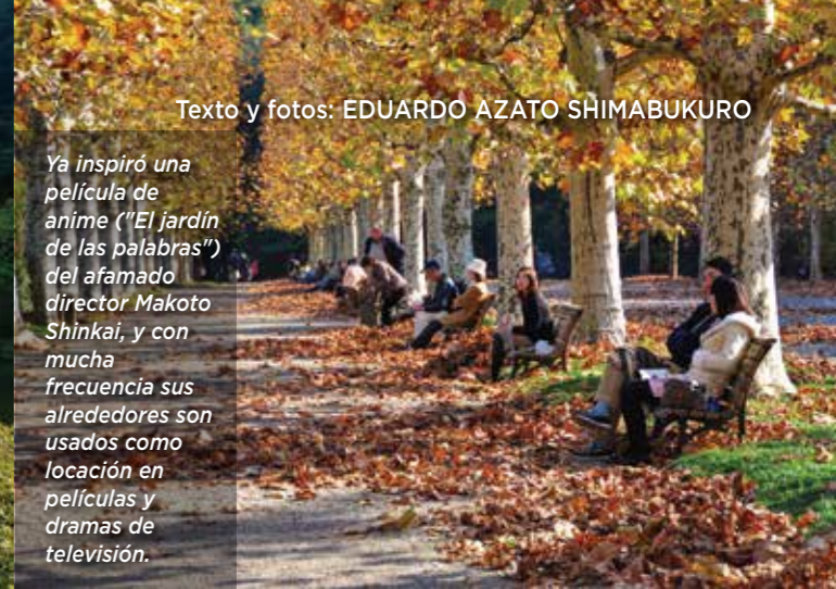
Texto y fotos: EDUARDO AZATO SHIMABUKURO