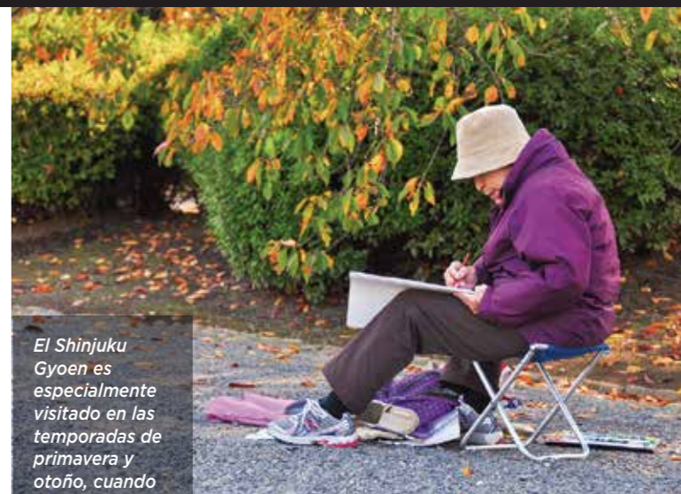
El Shinjuku Gyoen es especialmente visitado en las temporadas de primavera y otoño, cuando todos los visitantes intentan captar los colores de la vegetación.

Dentro de los jardines existen también dos Casa del Té, en la que, previa reservación, puede ser introducido en el conocido ritual japonés de preparar el té verde (chadō), y hasta probar algunos pastelillos tradicionales. Hay también un restaurante y un par de cafés.