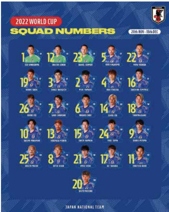
Los Samurai Blue: 20 de los 26 juegan en el exterior

Pero tras este dato hay mucho más, pese a que corrobora que los cuartos de final aún son un objetivo a cumplir. Es la consecución de todo un proyecto, una “hoja de ruta” marcada en plazos y objetivos que pueden ser susceptibles de variaciones, pero que tienen una sola finalidad: disputar la final del Mundial 2050 y ganarla.