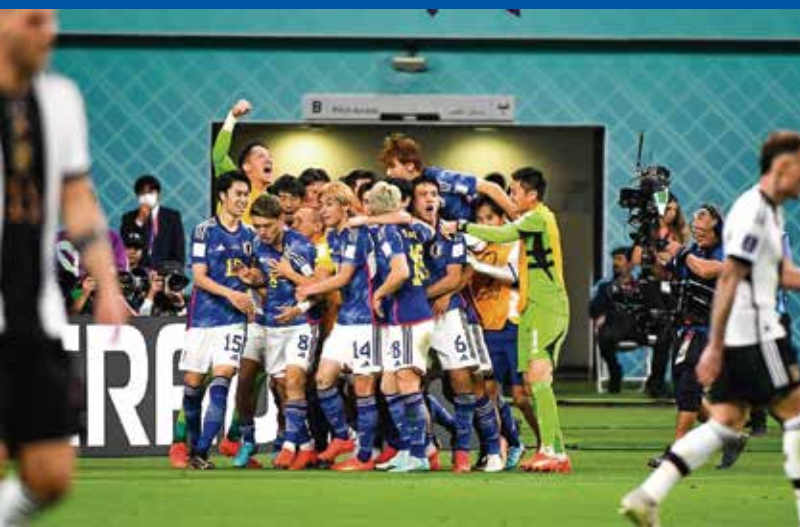
La Asociación Japonesa de Fútbol espera que la familia del fútbol japonés crezca hasta los 10 millones, entre jugadores, instructores, árbitros e hinchas