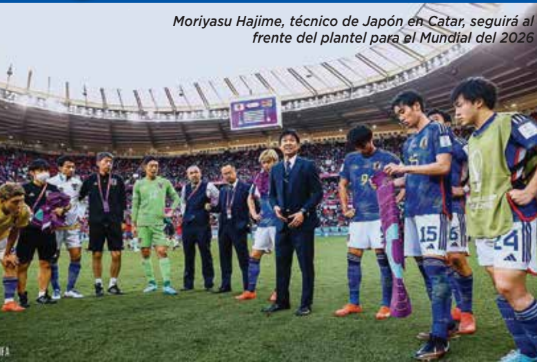
Moriyasu Hajime, técnico de Japón en Catar, seguirá al frente del plantel para el Mundial del 2026