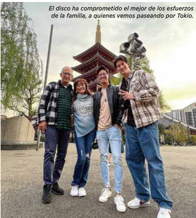
El disco ha comprometido el mejor de los esfuerzos de la familia, a quienes vemos paseando por Tokio.

“A pesar de haber trabajado con muchos artistas famosos y estar acostumbrados a ello, mis hijos me han ayudado muchísimo para que todo salga bien. Ésa es una de las cosas que también me ha hecho muy feliz: ver cómo se desenvuelven en el terreno profesional y recibir de ellos tanta comprensión y, sobre todo, paciencia. Todo esto para mí es nuevo y siempre me alentaron a hacerlo mejor”, comenta sobre cómo fue tener como productores a sus propios hijos.