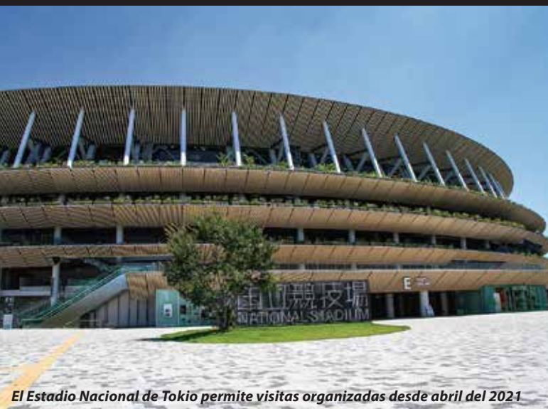
El Estadio Nacional de Tokio permite visitas organizadas desde abril del 2021