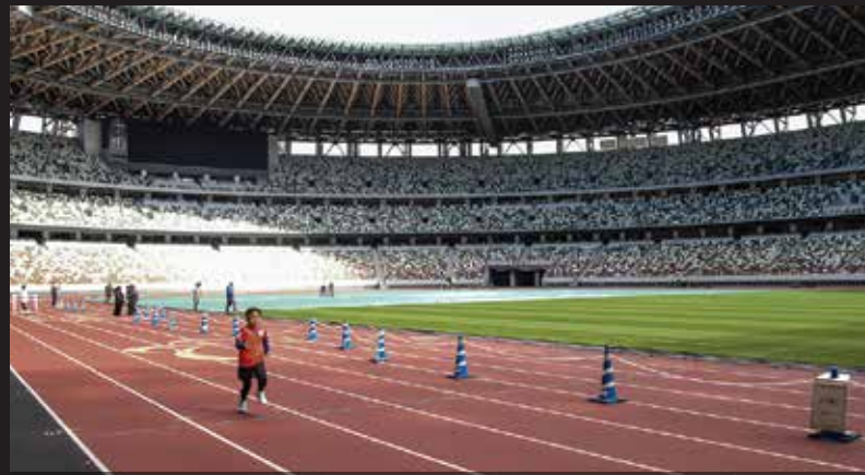
La visita al Estadio Nacional de Tokio permitirá a los participantes ingresar al propio campo y experimentar andar sobre la pista atlética