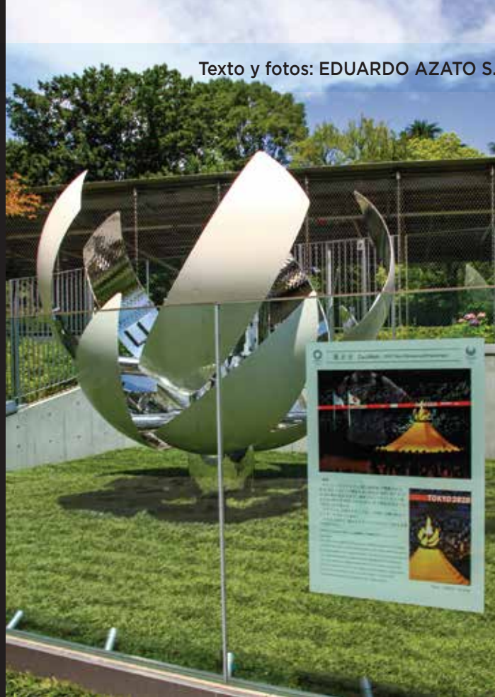
Texto y fotos: EDUARDO AZATO S.