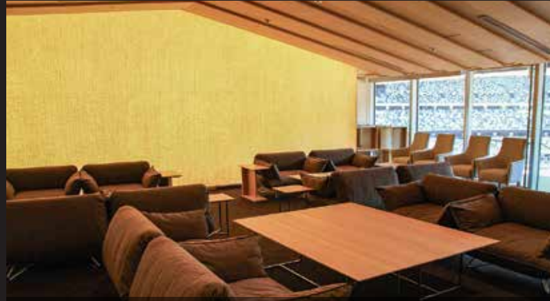
Vista de las instalaciones de la Sala VIP del estadio. Allí se reúnen las personalidades antes de ocupar sus asientos en el palco oficial