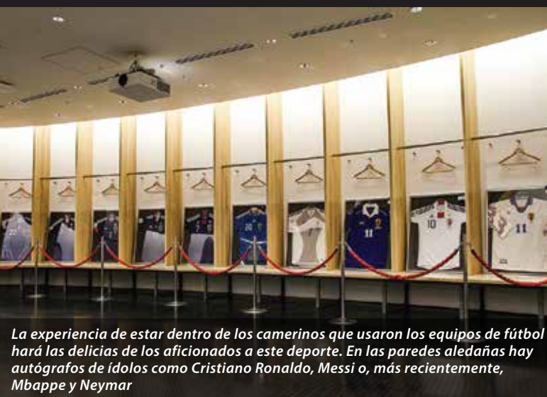
La experiencia de estar dentro de los camerinos que usaron los equipos de fútbol hará las delicias de los aficionados a este deporte. En las paredes aledañas hay autógrafos de ídolos como Cristiano Ronaldo, Messi o, más recientemente, Mbappe y Neymar