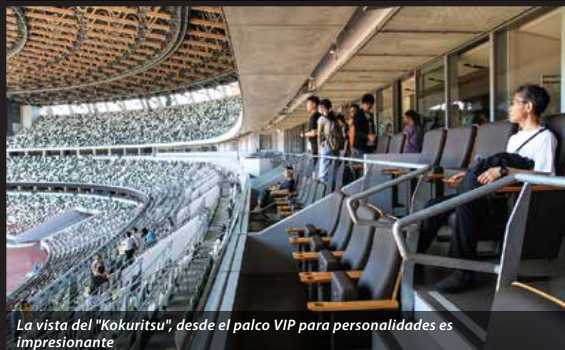
La vista del "Kokuritsu", desde el palco VIP para personalidades es impresionante