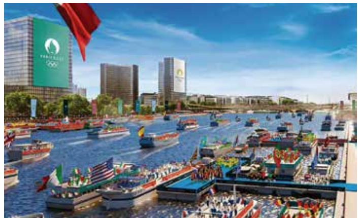
Imagen de la forma cómo se celebrará el acto de inauguración al aire libre sobre el río Sena, con las delegaciones de deportistas saludando al público desde más de un centenar de embarcaciones.