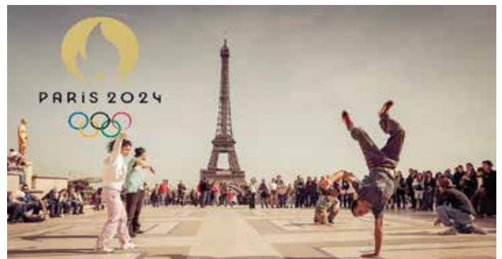
El breaking (breakdance) será el único deporte nuevo en los XXXIII Juegos Olímpicos.

MUCHAS SEDES, POCOS NUEVOS DEPORTES... PARÍS 2024 ha previsto desarrollar las jornadas del evento en nada menos que 39 sedes de competición, entre las que se encuentran patrimonios históricos como los jardines del Trocadero (ciclismo en ruta y las pruebas de maratón y marcha), el Palacio de Versalles (equitación y esgrima) o la Plaza de la Concordia (las fechas del breaking, baloncesto 3x3 y skateboard). Las pruebas del surf se trasladarán a las playas de Tahití. Se le critica a PARÍS 2024 solo haber incluido al breaking (break dance) como deporte nuevo; también que pese a continuar con la escalada y surf, que debutaron en Tokio, se haya excluido al béisbol, el sóftbol y al karate. Pese a ello, el Comité Olímpico Internacional incremen-