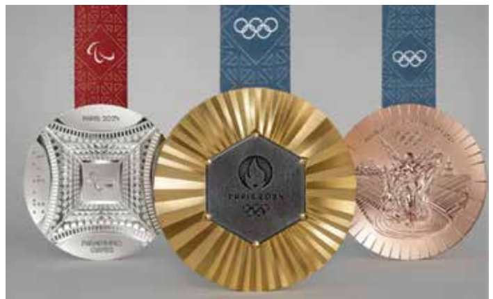
Las medallas de PARIS 2024 tienen en su elaboración parte de la Torre Eiffel.