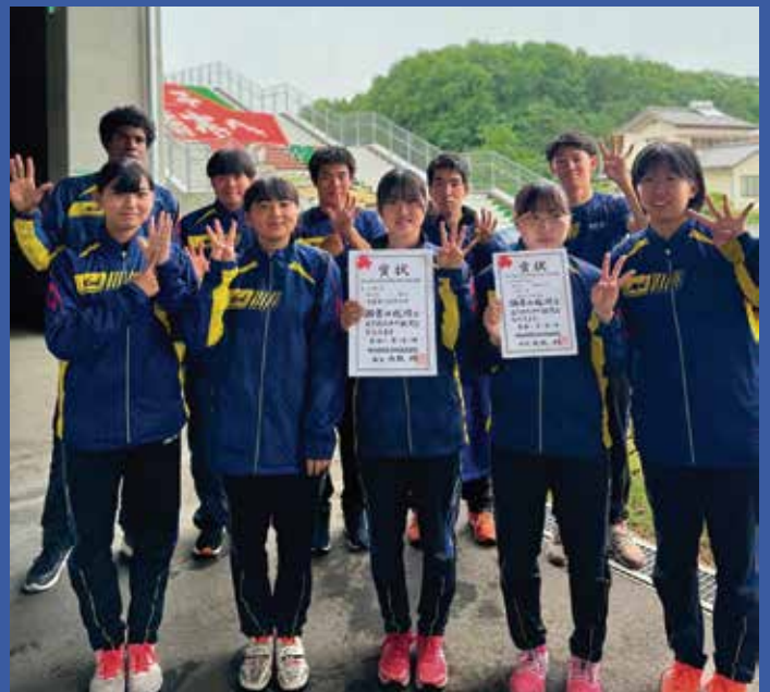
Con el equipo de atletismo de la escuela Seiran Taito de la ciudad de Sano, en Tochigi

duda en apoyar material y moralmente al campeón de la casa y han sido muchas las veces que ha descansado en el trabajo, para viajar a otras prefecturas y verlo competir.