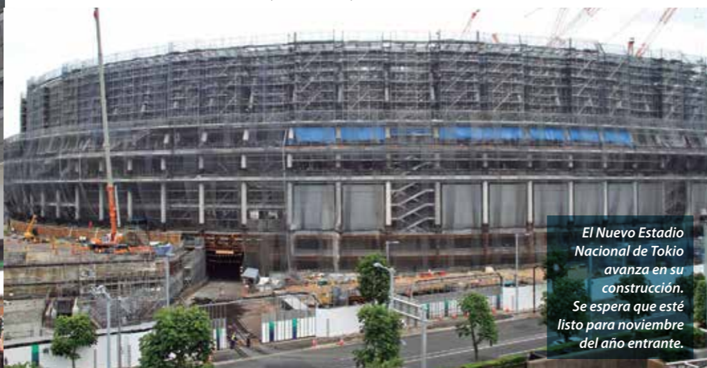
El Nuevo Estadio Nacional de Tokio avanza en su construcción. Se espera que esté listo para noviembre del año entrante.