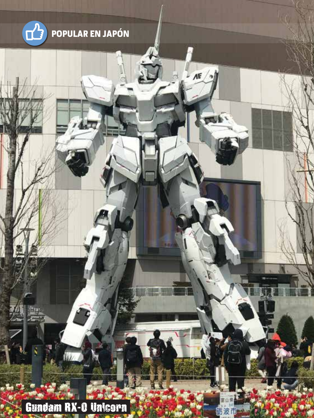
Gundam RX-0 Unicorn