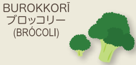
BUROKKORĪ ブロッコリー (BRÓCOLI)