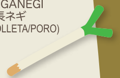
NAGANEGI 長ネギ (CEBOLLETA/PORO)