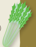
MIZUNA 水菜 (BERRO JAPONÉS)