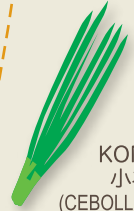
KONEGI 小ネギ (CEBOLLITA CHINA)